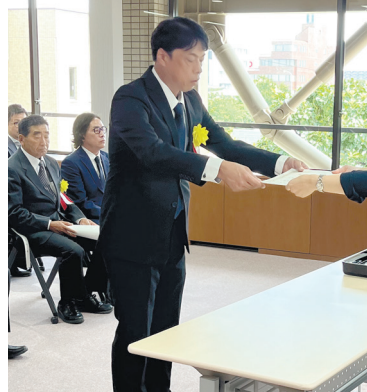
小宮山代表取締役